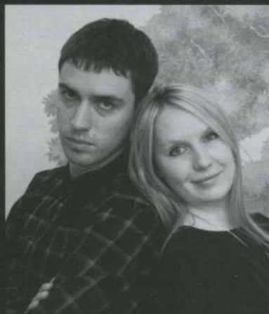
Авторы проекта: Алексей и Ольга Моисеевы

Этот объект, как и многие другие, создавался по принципу «до последней точки». Дизайнером была продумана каждая мелочь, в том числе декоративные полочки, постеры, панно из любимых фотографий жильцов квартиры. В итоге получился интерьер, который радует жильцов и удивляет гостей уже не первый год.